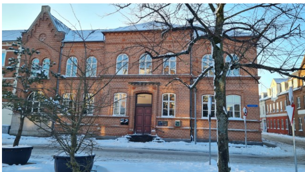
Selvhjælp Silkeborg – februar 2024

Igen i år har vi vist, at vi – via styrkende fællesskaber i selvhjælpsgrupper – gør en vigtig forskel. TAK til vores frivillige, vores medlemmer, vores samarbejdspartnere, vores ansatte gruppeledere, vores erhvervspartnere, vores sponsorer og bidragydere. Til alle jer som på så mange forskellige måder var med til at sikre, at Selvhjælp Silkeborg igen i 2023 kunne være der for børn, unge og voksne, når deres liv var svært.